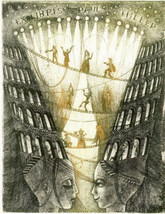
"Theater" A.P. etching 2005 Marine Tesaud